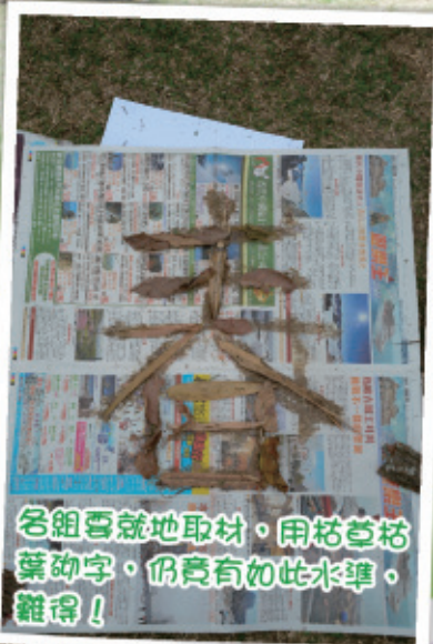
各組齊就地取材，用枯草枯葉砌字，仍竟有如此水準，難得！