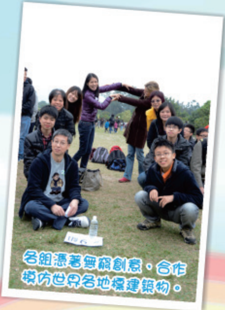
各組憑著無窮創意，合作模仿世界各地標建築物。

多謝家長教師會每年都舉辦親子活動，讓我對聖言中學，老師，校長多了接觸的機會。也讓我和兒子一同參與集體活動。從兒子幼稚園開始到現在，我堅持每年抽空出席親子旅行，因為我希望從多方面了解自己的兒子，也讓兒子感受到父母是多麼關心他們的一切。愛他們不是在言語上囉囉嗦嗦，而是與他們一同參與活動，用行動去愛他們。我也藉這機會向各位父母吐出心聲，與兒子一起參加活動的機會將會越來越少，我會很珍惜這些機會，給自己及兒子多一點歡樂的回憶。