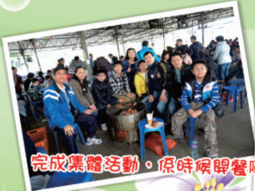
完成集體活動，係時候開餐嘞！！！！