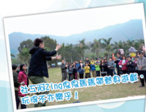
社交阿Zing與馬馬帶熱身遊戲，玩得亦樂乎！