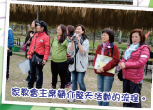
家教會主席簡介整天活動的流程。

家教會每年舉辦多項活動，達到老師、家長、學生互動的成果。期望各家長能踴躍支持及參與，並藉此機會，享受愉快的親子活動。