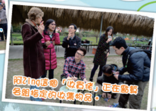
阿Zing這個「收西佬」正在點算各組指定的收集物品。