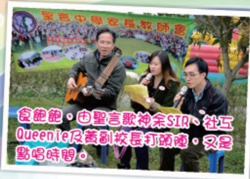
食飽飽，由聖言歌神余SIR、社工Queenie及善副校長打頭陣，又是點唱時間。