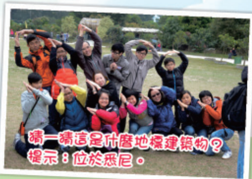
猜一猜這是什麼地標建築物？ 提示：位於悉尼。