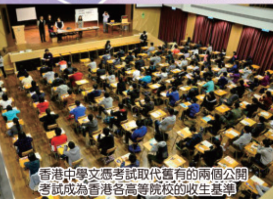
香港中學文憑考試取代舊有的兩個公開考試成為香港各高等院校的收生基準