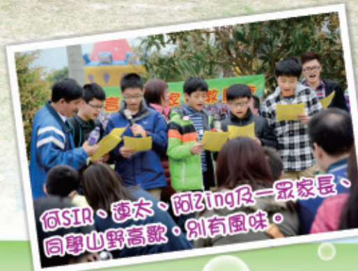
何SIR、連太、阿Zing及一眾家長、同學山野高歌，別有風味。