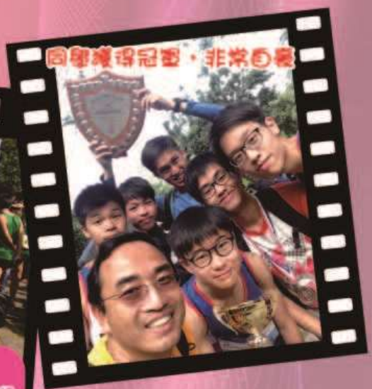
同學獲得冠軍，非常自豪