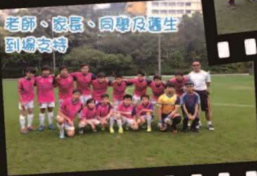
老師、家長、同學及舊生到場支持

甲組足球隊於今年學界比賽中奪得學界第二組別甲組殿軍，丙組足球隊亦有傑出表現，在學界比賽中奪得學界第二組別丙組季軍。