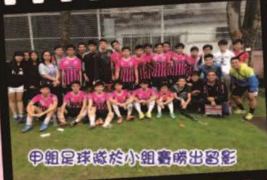
甲組足球隊於小組賽勝出留影