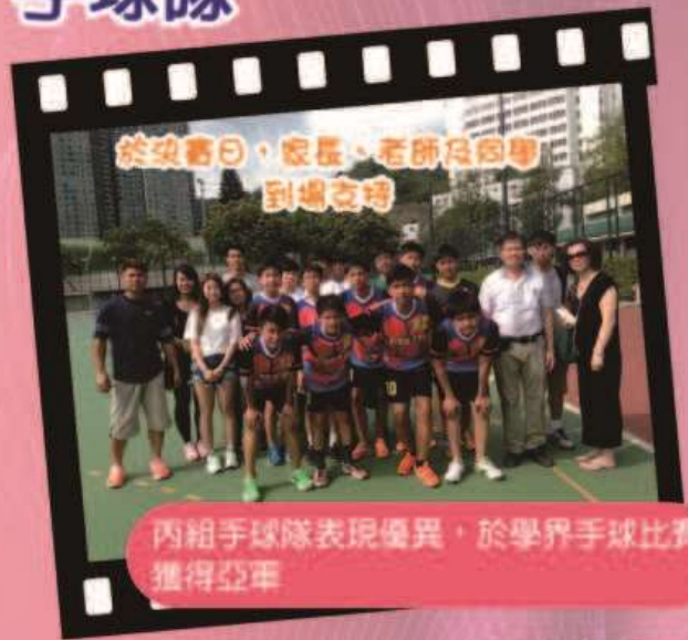
丙組手球隊表現優異，於學界手球比賽獲得亞軍