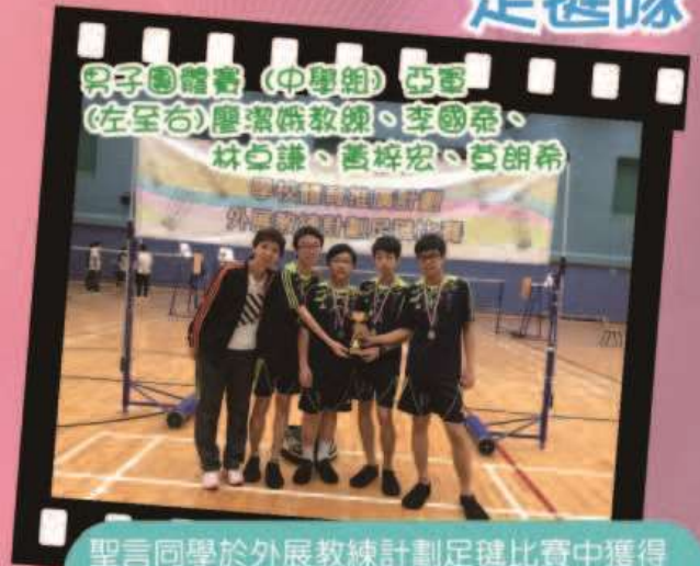
聖言同學於外展教練計劃足毬比賽中獲得優異成績。