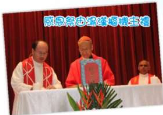
感恩祭由湯漢樞機主禮