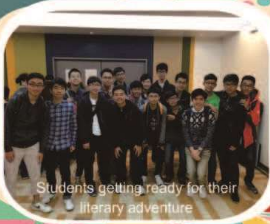
Students getting ready for their literary adventure

Twenty keen readers with creative talents from Form 4 were nominated to take part in the weekend events of the Hong Kong International Young Readers Festival 2015 in March. Through different talks and workshops, including "The Wonder of Fantasy", "A Magic Mirror", "Scientist/Writer" and "Fantasy Worlds with Jon Berkeley", our students not only explored fantastical literary worlds, real or imaginary, but also acquired useful writing tips from bestselling and widely acclaimed authors.