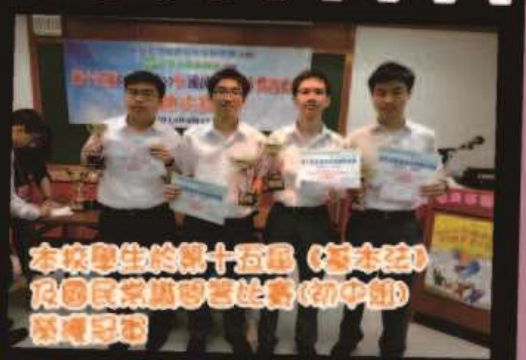
本校學生於第十五屆(基本法)及國民常識問答比賽(初中組)榮獲冠軍