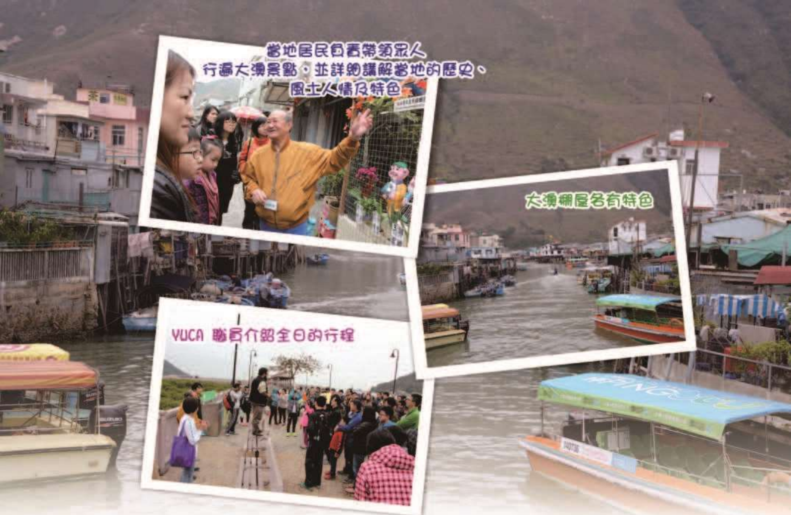
當地居民自西帶領眾人 行遍大澳景點，並詳細講解當地的歷史、 風土人情及特色