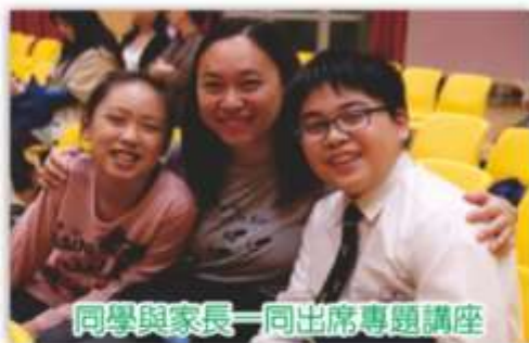
同學與家長一同出席專題講座

在講座完滿結束後，各位聽者是空手而回，還是滿載而歸，各有自知。如果只是聽而不為，為而不改，改而不優，則何變之有？而未有撥冗列席者，實為一種損失，只有參與其中，方能明其所以，置諸道外者，何論得失焉。希望下一次講座，各位能在百忙中抽空，細心品味講者的心意，切勿一再錯過。