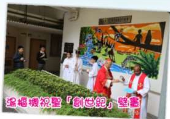
湯樞機祝聖「創世紀」壁畫

相信各位同學在觀賞過話劇後都明白到自己也是保護環境的一分子，亦希望日後學校可以多舉辦有關活動，為全校同學宣揚和建立環保意識。