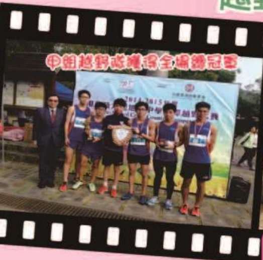
甲組越野隊奪得全場總冠軍